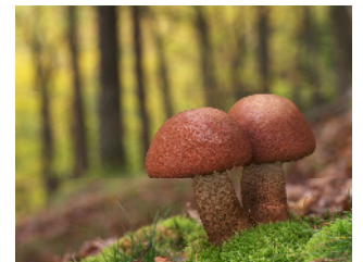
Eichenrotkappe, Leccinum aurantiacum

Das überwiegend sehr steile Gelände erfordert unbedingt festes Schuhwerk.