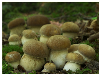
Eichensteinpilze, Boletus reticulatus