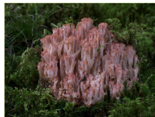
Hahnenkamm, Ramaria botrytis