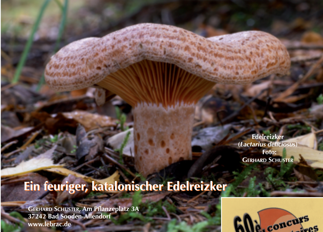
Edelreizker ( Lactarius deliciosus )