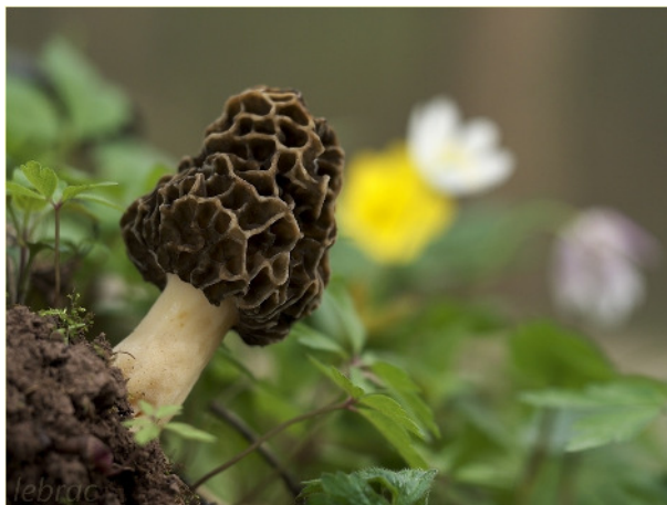
Speisemorchel, Morchella esculenta

Der oberhalb des Flachsachtals gelegene Habichtstein besteht aus dolomitischem Zechsteinkalk, der vom Regen gelöst wird und in zahlreichen Quellen an den unteren Talflanken im Buntsandstein als Kalksinter ausfällt. Die Kalkquellmoore und die vielen alten Eschen bieten beste Bedingungen für das Wachstum der Morchelarten.