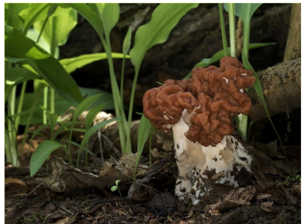
Kyffhäuser- oder Zipfel-Lorchel, Gyromitra fastigiata

Treffpunkt am 21.04.2018 um 14:00 Uhr ist der Wasserspielplatz Öhrchen, Flachsachtal, 37213 Witzhausen/Wendershausen direkt am Werra-Burgensteig.