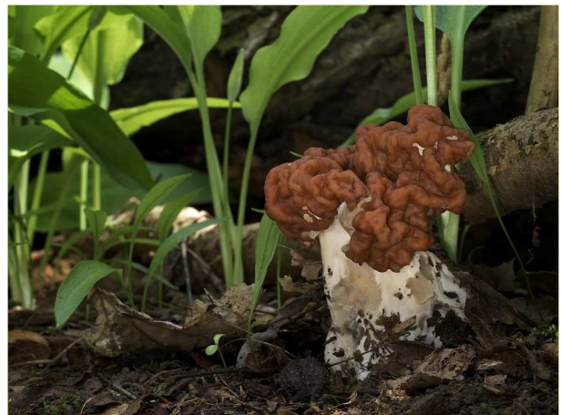
Kyffhäuser- oder Zipfel-Lorchel, Gyromitra fastigiata

Treffpunkt am 28.04.2018 um 14:00 Uhr ist der Wasserspielplatz Öhrchen, Flachsachtal, 37213 Witzhausen/Wendershausen direkt am Werra-Burgensteig.