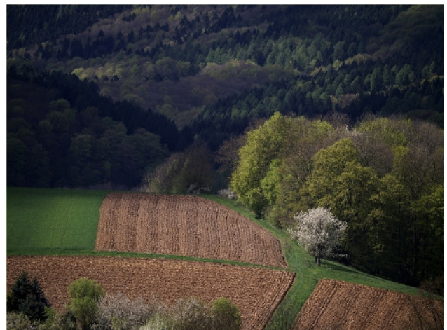
Kleinräumige Landwirtschaft im Meißnerland

Treffpunkt am 05.05.2018 um 17:00 Uhr ist am Naturfreundehaus auf dem Hohen Meißner, Regina-Fahrenbach-Straße 4, 37235 Hessisch Lichtenau.